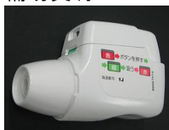
ジェヌエア練習器 (乳糖ありとなしそれぞれ)