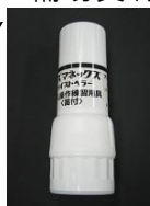
吸入操作練習用具